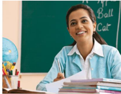
B. un profesor/una profesora