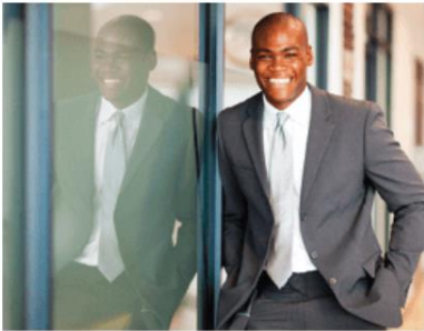
C. el director/la directora (principal)