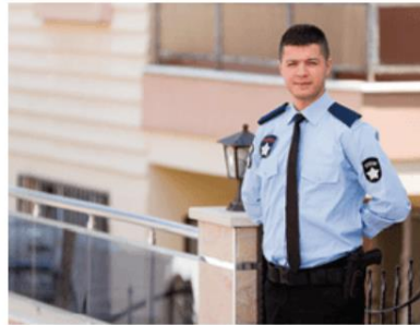
D. el/la guardia de seguridad (the security guard)

1 "Ayudo a mis estudiantes cuando tienen dificultades."